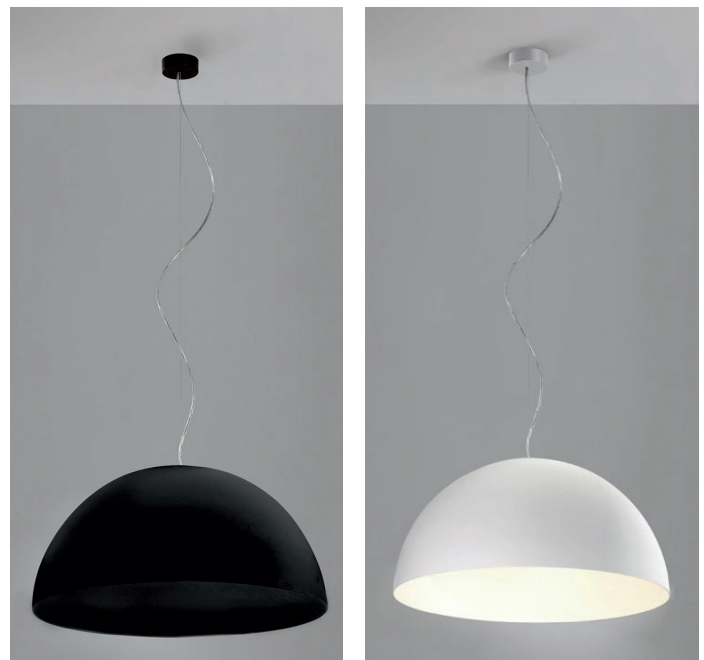
.02 Nero - Black